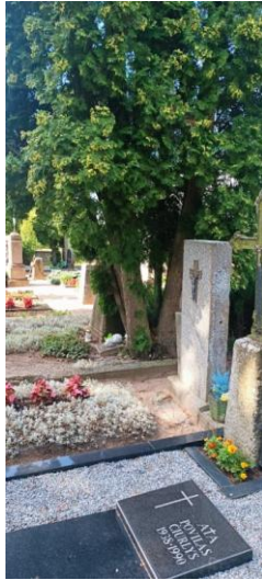
Pav. Nr. 9