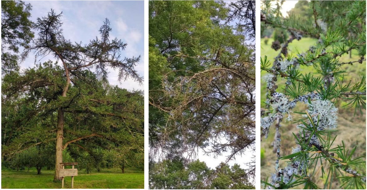
12 pav. Stirniškių kurilinis maumedis