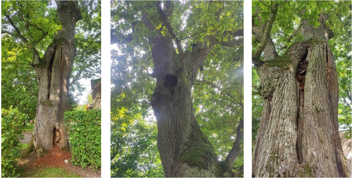
16 pav. Alizavos paprastojo ąžuolo būklė