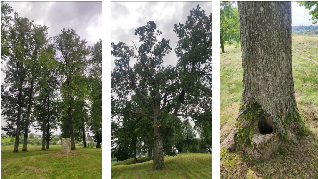
3 pav. Kupiškio m. Piliakalnio želdiniai

Kupiškio m. Piliakalnio želdyne dauguma stebėtų medžių geros būklės (3 pav.). Dviems medžiams nustatyta vidutinė kamieno žaizda dėl stambių šakų išlūžimo.