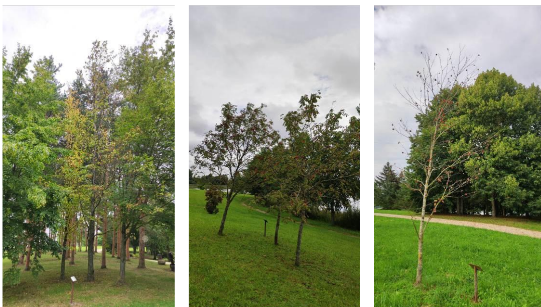
6 pav. Uošvės Liežuvio dendroparko želdinių būklė

Jautresni aplinkos sąlygoms ir sunkiau dendroparke auga paprastieji šermukšniai – jiems stebėta defoliacija, lapų nekrozės ir lajų išretėjimas (6 pav.). Vienas paprastas skroblas išskirtinai stipriau buvo paveiktas defoliacijos ir dechromacijos. Kai kurie jaunesni medeliai (pvz. puošmedis) sunkiau prigyja – labai sumažėja ir pradeda džiūti, tokiu būdu sustoja augalo gebėjimas apsirūpinti maisto medžiagomis.