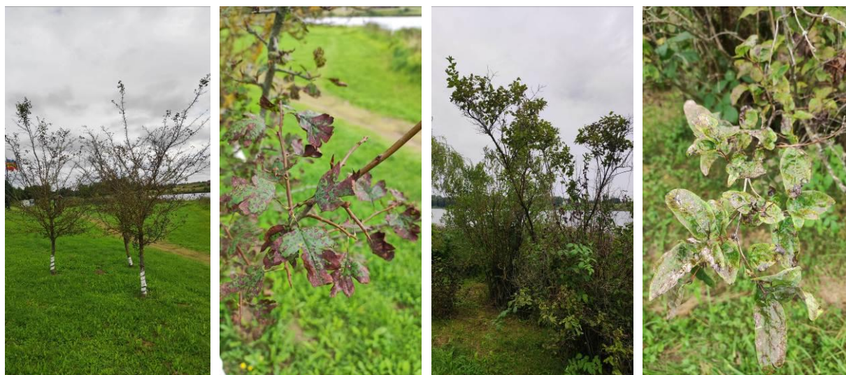
4 pav. Uošvės Liežuvio dendroparko dekoratyvinių krūmų būklė

Uošvės Liežuvio dendroparkas ypatingas želdinių įvairove ir jaukiai suformuotomis erdvėmis. Daugelis čia stebėtų įvairių dekoratyvinių krūmų rūšių ir veislių yra geros būklės ir tik nedaugelis jų yra jautresni įvairiems pakenkimams. Totoriniams sausmedžiams stebėtas lajos praretėjimas, pažeisti, skurdūs ir spalvą praradę lapai, grauželinėms gudobelėms – lapų nekrozė ir defoliacija, švelniosioms gudobelėms – kamieno žaizdos (4 pav.).