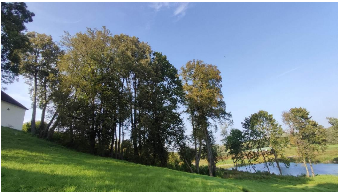
11 pav. Palėvenės vienuolyno želdyno liepų eilė

Palėvenės vienuolyno želdyno liepų būklė bloga dėl drevių ir didelių išpuvusių ertmių kamiene. Medžių lajos vizualiai sveikos, tik keliems medžiams stebėta defoliacija ir sausos šakos (11 pav.). Didžiąjai daliai medžių nustatytos kamieno žaizdos ir medienos puviniai. Liepų eilės gale augusios itin blogos būklės liepos (ir pati upės pakrantė) pašalintos ir sutvarkytos, tad pagyvėjo estetinis aplinkos vaizdas.