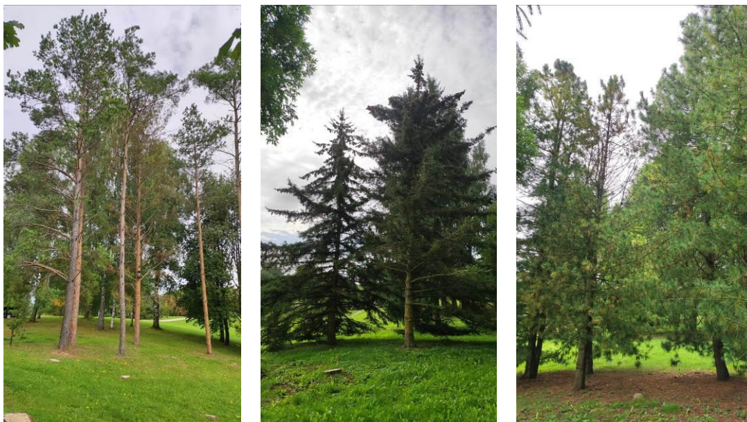
5 pav. Uošvės Liežuvio dendroparko spygliuočių želdinių būklė

Dendroparke defoliacija dažniau stebėta spygliuočiams medžiams – paprastajai, sibirinei ir paprastosioms pušims, baltosioms ir dygiosioms eglėms (5 pav.). Ypač stipri defoliacija ir spyglių nekrozės stebėti kalninėms pušims.