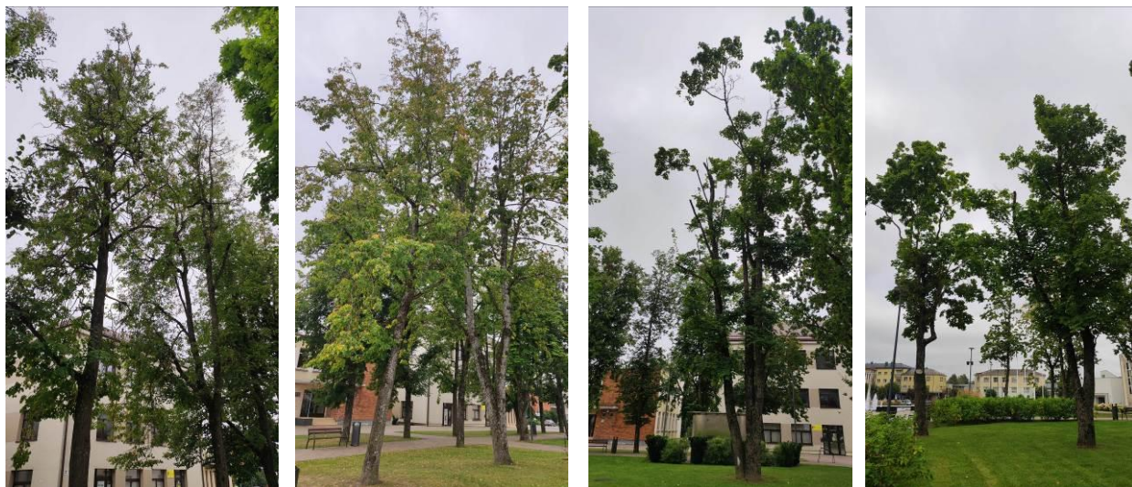
1 pav. Kupiškio m. L. Stuokos-Gucevičiaus aikštės želdiniai

lapus. Mažalapėms liepoms kiek gausiau buvo nustatyta defoliacija, lapų sumažėjimas ir lajos išretėjimas. Kelių medžių kamienuose prasidėję medienos irimo procesai.