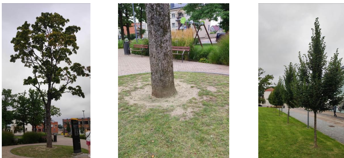
2 pav. Kupiškio m. L. Stuokos-Gucevičiaus aikštės želdiniai

Paprastųjų klevų lajos išretėjusios, stebima sausų šakų. Labiau aikštės centre augančiam klevui stebėtas lajos išretėjimas, tačiau kitų pakenkimų nenustatyta. Šio medžio pomedis gana stipriai sutryptas ir suplūktas (2 pav.), tad labai svarbu atlikti dirvožemio aeracija, vienas iš sprendimo būdų – galėtų būti neaukštos tvorelės apjuosimas ir padengimas mulčiu, kuris ilgiau sulaikys drėgmę ir neleis susislėgti dirvožemiui.