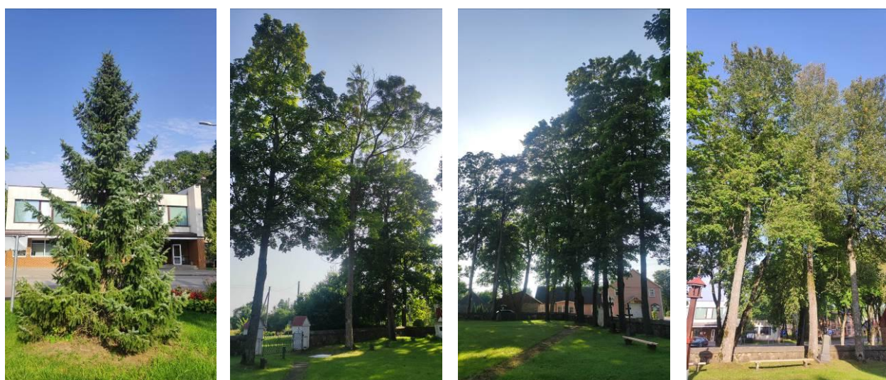
8 pav. Šimonių serbinė eglė ir bažnyčios šventoriaus medžiai

Šimonių sen. serbinė eglė – jaunas ir perspektyvus medelis, pakenkimų nepastebėta. Šimonių sen. bažnyčios šventoriaus želdyne augantys paprastieji ąžuolai, mažalapės liepos ir dygioji eglė f.glauca yra geros būklės (8 pav.).