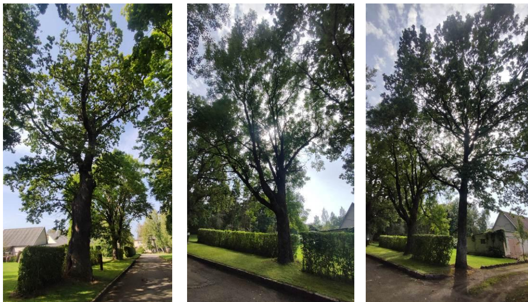
7 pav. Alizavos paprastasis ąžuolas (GPO) ir jo kaimynai

Alizavos paprastasis ąžuolas (GPO) stebėtas kartu su dviem kaimynais – paprastuoju uosiu ir paprastuoju ąžuolu (7 pav.). Alizavos ąžuolui būklė bloga, tačiau blogėjimo nestebima – kamienne stebimos didelės žaizdos ir išplitęs medienos puvinys (minkštas, birus), vietomis atsokusi kamieno žievė. Kitas ąžuolas ir uosis yra geros būklės, kamieno pažeidimų nenustatyta, lajose nežymus sausų šakų kiekis.