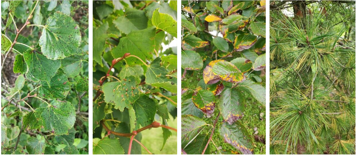
13 pav. Lapų ir spyglių pakenkimai – lapų rudmargė (Palėvenės vienuolyne), liepinė gyslinė erkė (L. Stuokos-Gucevičiaus a.), lapų nekrozė (Uošvės Liežuvio dendroparke)

Lapų miltligė (14 pav.) stebėta skirtingoms medžių rūšims – paprastajam ąžuolui ( Microsphaera alphitoides Griff. et Maubl.), ginaliniams klevams ( Uncinula tulasnei Fuck.), paprastiesiems raugerškiams ( Microsphaera berberidis (DC) Lev.).