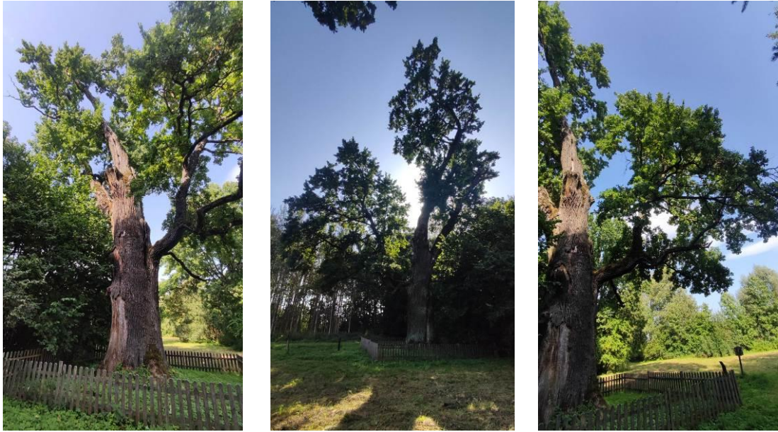
10 pav. Buivėnų paprastasis ąžuolas (GPO)

Palėvenės vienuolyno želdyno liepų būklė bloga dėl drevių ir didelių išpuvusių ertmių kamiene. Medžių lajos vizualiai sveikos, tik keliems medžiams stebėta defoliacija ir sausos šakos (11 pav.). Didžiąjai daliai medžių nustatytos kamieno žaizdos ir medienos puviniai. Liepų eilės gale augusios itin blogos būklės liepos (ir pati upės pakrantė) pašalintos ir sutvarkytos, tad pagyvėjo estetinis aplinkos vaizdas.