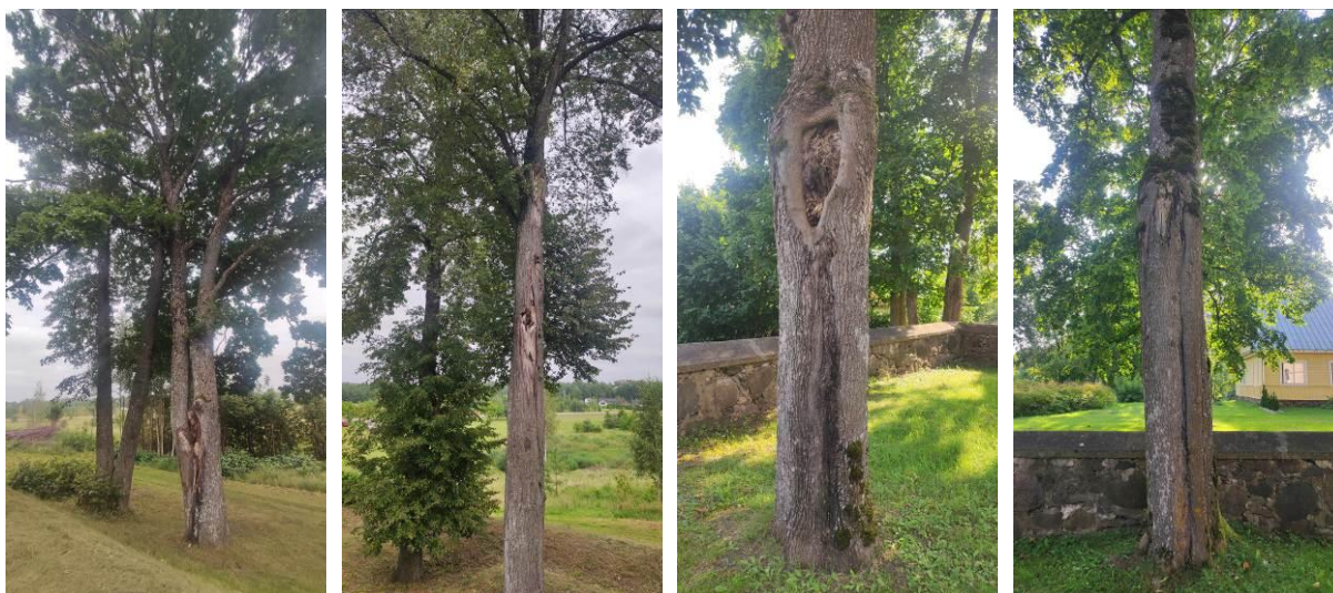
19 pav. Piliakalnio ir Šimonių šventoriaus ir aikštės medžių būklė

Kupiškio m. Piliakalnio želdyne vidutinės būklės stebėti du medžiai – paprastasis klevas su stambia išlūžusia šaka ir susiformavusia didele žaizda ir mažalapė liepa, kurios kamienne žaizda dėl stambios šakos išlūžimo, o kitoje kamieno pusėje ilga išilginė užsiverianti žaizda.