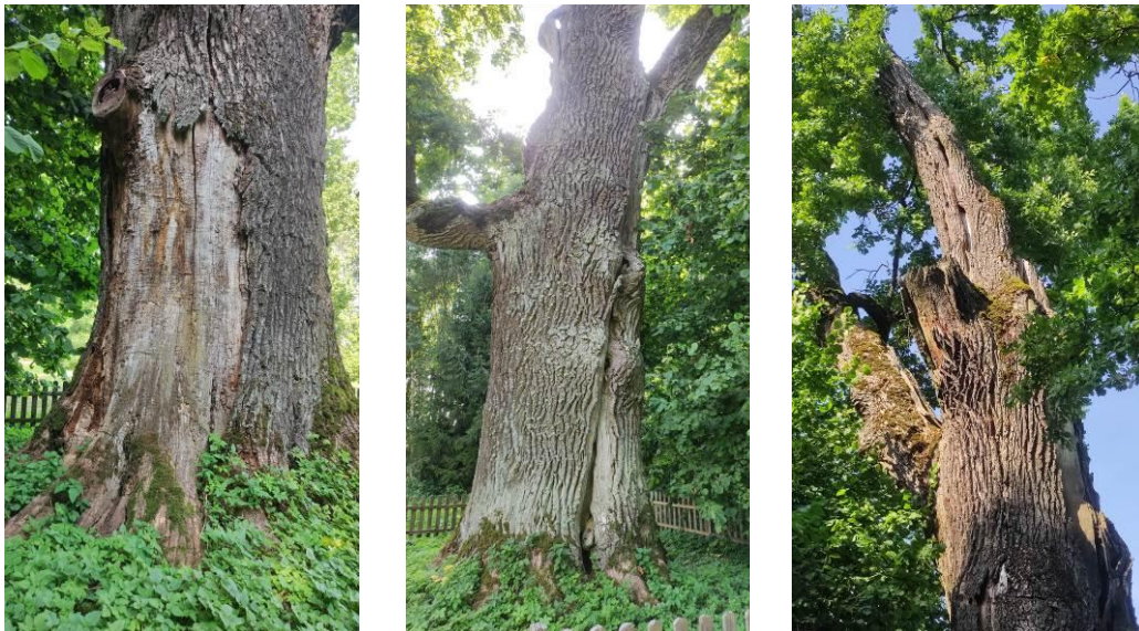
17 pav. Buivėnų paprastojo ąžuolo būklė