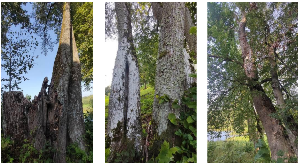
18 pav. Palėvenės vienuolyno želdyno medžių būklė