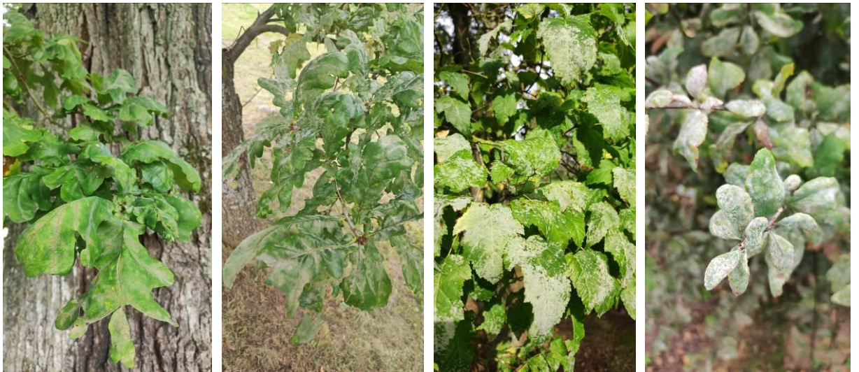
14 pav. Lapų pakenkimai – ąžuolo miltligė (Alizavos ir Piliakalnio), Liežuvio klevas ir raugerskis

Lapų miltligė (14 pav.) stebėta skirtingoms medžių rūšims – paprastajam ąžuolui ( Microsphaera alphitoides Griff. et Maubl.), ginaliniams klevams ( Uncinula tulasnei Fuck.), paprastiesiems raugerškiams ( Microsphaera berberidis (DC) Lev.).