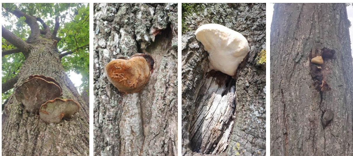
15 pav. Medžių kamienų pakenkimus sukeltantys grybai

2025 m. stebėsenos metu, Kupiškio rajono savivaldybės želdynuose buvo stebėti įvairūs medienos irimą skatinantys grybai (15 pav.). Medienos puviniai dažniau nustatyti genėjimo vietose susiformavusiose drevėse, taip pat susidarę dėl mechaninių kamieno pažeidimų. Didelės išilginės žaizdos ant medžių kamienų gali susidaryti dėl žaibo. Žiemospirgis – žaizdos medžių kamienne susidariusios dėl temperatūros svyravimų ar didelio šalčio poveikio.